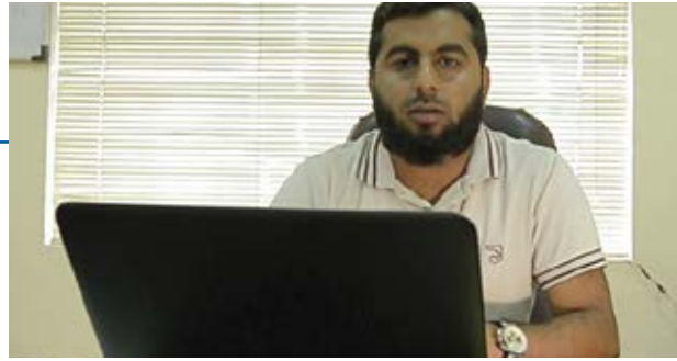
آپ کا کل آپ کے آج سے شروع ہوتا ہے