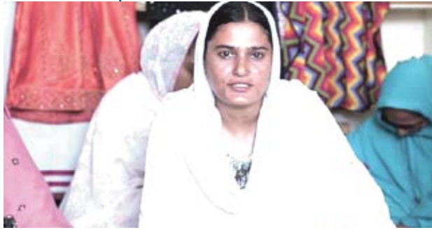
یقین پر عزم ہو تو منزل ضرور ملتی ہے