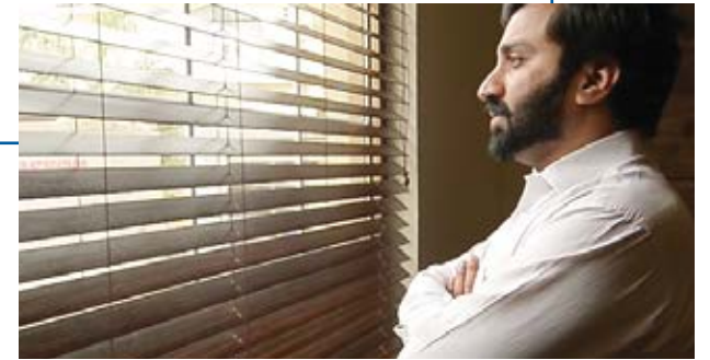
اپنی محنت اور محنت سے کر دکھاؤ