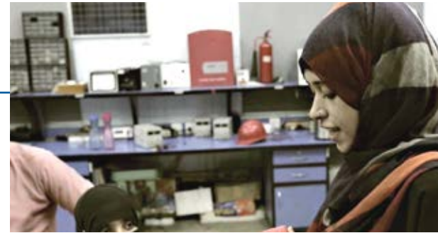
ناکامی نے اسے کبھی نہیں روکا

عہدہ: انوینٹری مینیجر، چائے خانہ راولپنڈی