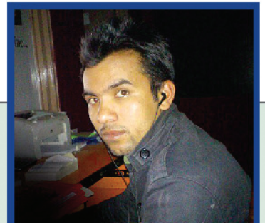
نئی منزلوں کی تلاش