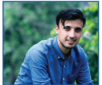
تیورخان ایسوسی ایٹ (مانیٹرنگ اینڈ ایویویشن)

پچھلے تین سال سے پی ایس ڈی ایف میں میری ملازمت کی وجہ سے کہ میں ہر دن ایک نئے ایک چیلنجز کا سامنا کرنے کو ملتا ہے۔ میں خود کو بہت خوش قسمت سمجھتا ہوں کہ میں نے پی ایس ڈی ایف کے زیر سایہ بہت سے با مقصد اقدامات میں بھرپور حصہ لیا ہے۔ ان اقدامات کی وجہ سے پنجاب کے غریب اور مستحق لوگوں کی زندگی میں بہتری اور خوشحالی آئی ہے۔